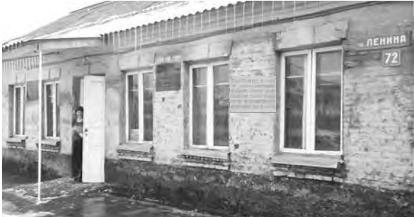
На снимке: здание городской библиотеки. Здесь 1 (14) февраля 1918 года состоялся V съезд осетинского народа, на котором было принято Положение (Конституция) "Об осетинском национальном совете".

Сустановлением советской власти на Северном Кавказе было положено начало строительства национальной государственности горских народов. В научной литературе существуют разночтения по поводу начала становления и развития государственности народов Северного Кавказа (Терека). Чтобы определиться в данном вопросе, обратимся к историческим фактам. 16 февраля (1 марта) 1918 г. в Пятигорске открылся II съезд народов Терека, который закончил свою работу во Владикавказе и провозгласил образование Терской советской республики. В ее состав вошли 4 отдела, где жили казаки: Пятигорский, Моздокский, Кизлярский, Сунженский, 6 округов, где жили горские народы: Владикавказский округ — осетины; Назрановский — ингуши; Грозненский и Веденский — чеченцы, Нальчикский — кабардинцы и балкарцы, Хасавюртовский — кумыки;